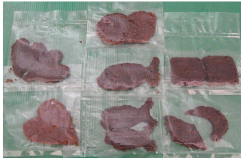
ภาพที่ 3 รูปทรงของปลาหวานที่นักศึกษาออกแบบ

2) การพัฒนาบรรจุภัณฑ์ การอบรมบรรจุภัณฑ์โดยวิทยากรจากบริษัทที่รับออกแบบและผลิตบรรจุภัณฑ์ ได้ถ่ายทอดความรู้เกี่ยวกับบรรจุภัณฑ์ชนิดกล่องกระดาษ เพราะเป็นบรรจุภัณฑ์ที่เพิ่มมูลค่าให้ผลิตภัณฑ์ได้และนักศึกษาสามารถทำได้ด้วยตนเอง การให้ความรู้เริ่มต้นด้วยการบรรยายประกอบสื่อร่วมกับการเสนอผลงานของวิทยากรเพื่อให้นักศึกษาเกิดแนวคิดในการออกแบบบรรจุภัณฑ์และตราสินค้า ตามด้วยการสาธิตวิธีการทำเพื่อให้นักศึกษาเกิดความสนใจและเข้าใจได้ดียิ่งขึ้น จากนั้นแบ่งกลุ่มนักศึกษาให้ช่วยกันคิดและออกแบบพร้อมทั้งลงมือทำบรรจุภัณฑ์ต้นแบบด้วยตนเอง ผลการศึกษาพฤติกรรมและความสามารถของนักศึกษา (ตารางที่ 2) และผลงานบรรจุภัณฑ์ต้นแบบ (ภาพที่ 4) พบว่า จากบรรยากาศการเรียนที่สนุกสนานและเป็นกันเอง ทำให้นักศึกษากล้าคิดกล้าแสดงออก การเรียนโดยเน้นให้เห็นของจริงและฝึกปฏิบัติในทันที ทำให้นักศึกษาเกิดการเรียนรู้ได้ง่ายและรวดเร็ว นอกจากนั้นด้วยระยะเวลาอันจำกัด ทำให้นักศึกษาเกิดความสามัคคีร่วมมือกันคิดและผลิตผลงาน แต่ต้องมีผู้คอยชี้แนะเนื่องจากนักศึกษายังขาดประสบการณ์ เมื่อได้ผลงานออกมาทำให้นักศึกษาภาคภูมิใจและสนใจที่จะเรียนรู้เพิ่มเติม ซึ่งวิทยากรได้แนะนำวิธีการเรียนรู้เพิ่มเติมและยินดีให้คำปรึกษา ดังนั้นจะเห็นได้ว่า การจัดการเรียนการสอนและความสามารถของผู้สอนมีอิทธิพลต่อการเรียนรู้และการแสดงออกของนักศึกษามาก