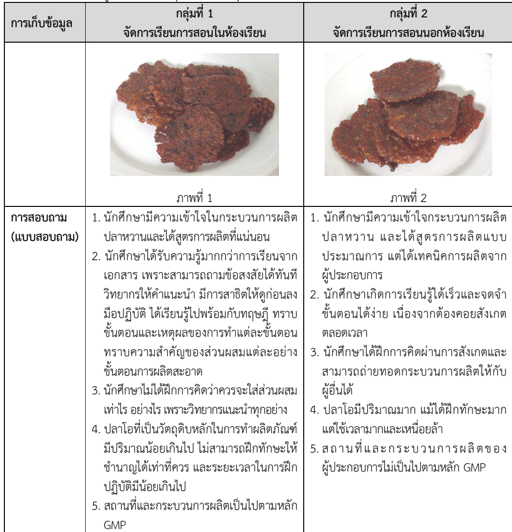
ตารางที่ 1 ผลการเรียนรู้ของนักศึกษากลุ่มที่ 1 และ กลุ่มที่ 2 (ต่อ)