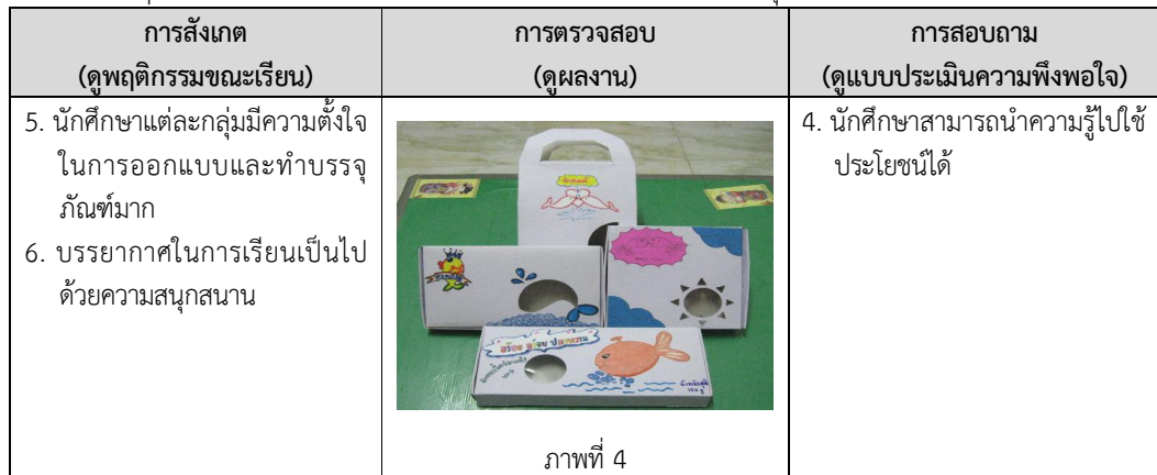
ตารางที่ 2 พฤติกรรมและความสามารถของนักศึกษาในกิจกรรมการพัฒนาบรรจุภัณฑ์ (ต่อ)