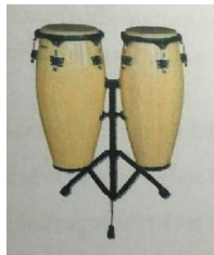
ภาพที่ 1 กลองคองก้า

2.1.1 กลองคองก้าหรือกลองทอมบ้า เป็นกลองชนิดหนึ่งมีหน้าที่ในการควบคุมจังหวะ มีความสูงประมาณ 30 นิ้ว เส้นผ่าศูนย์กลางประมาณ 11 นิ้ว ตัวกลองทำด้วยไม้ เป็นกลองหน้าเดียวซึ่งด้วยหนังสัตว์ มีหลายขนาดต่างระดับเสียงกันใช้อย่างต่ำ 2 ใบ ตีสอดสลับกันตามลีลาจังหวะของบทเพลง ตีด้วยปลายนิ้วและฝ่ามือ