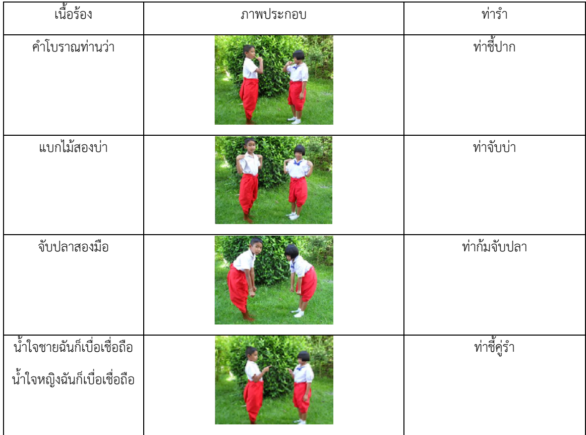
ตารางที่ 2 ตัวอย่างท่ารำที่ไม่ได้ตีความหมายตามเนื้อร้อง (เพลงมากันเถิดหนา)