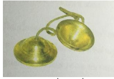
ภาพที่ 2 ฉิ่ง

ที่มา ปุณณวิช เพชรสุวรรณ, 28 มิถุนายน 2557