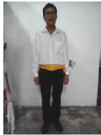
รูปที่ 4 การแต่งกายของนักแสดงชาย ที่มา ปุณณวิช เพชรสุวรรณ, 2 กรกฎาคม 2557

2.4 เครื่องแต่งกาย ในการแสดงรำโชนสทิงพระนั้นยังคงยึดการแต่งกายในรูปแบบเดิมอยู่ โดยในยุคที่รำโชนได้รับความนิยมนั้นเป็นช่วงที่รัฐบาลนครนรงค์ให้คนไทยหันมาแต่งกายตามแบบตะวันตก นักแสดงหญิงจะสวมเสื้อมีระบายที่ช่วงไหล่ นุ่งกระโปรงสุ่มยาว ผมหักดอกไม้ เครื่องประดับสวมใส่แล้วแต่บุคคล มีจุดเด่นที่เสื้อผ้าจะมีสีสันฉูดฉาดสดใส และนักแสดงไม่จำเป็นต้องสวมเสื้อผ้าในสีและรูปแบบเดียวกันทั้งหมด ส่วนนักแสดงชายนั้นสวมเสื้อแขนยาวสีขาว อาจติดโบว์ตรงคอเสื้อหรือมีผ้าคาดเอว สวมกางเกงขายาวสีดำ และรองเท้าว้าใบ ตัวอย่างดังรูป