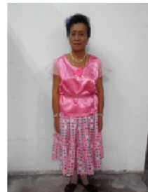
รูปที่ 5 การแต่งกายของนักแสดงหญิง ที่มา ปุณณวิช เพชรสุวรรณ, 2 กรกฎาคม 2557

2.5 ลำดับการแสดง การแสดงรำโชนสทิงพระมีลำดับการแสดงที่ถูกกำหนดไว้ว่าจะต้องเริ่มต้นด้วยเพลงไหว้ครูเป็นลำดับแรก และเพลงมากันเกิดหนาเพื่อชักชวนฝ่ายชายให้ออกมารำด้วยกัน ส่วนลำดับต่อมานั้นจะไม่กำหนดสามารถใช้เพลงใดก็ได้ และจำนวนเพลงนั้นก็ขึ้นอยู่กับระยะเวลาในการแสดง