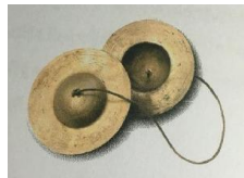
ภาพที่ 2 ฉิ่ง

2.1.3 ฉาบ เป็นเครื่องดนตรีประเภทตี ทำด้วยโลหะคล้ายฉิ่ง แต่หล่อให้บางกว่า เวลาบรรเลงใช้สองฝ่ากระทบกันให้เกิดเสียงตามจังหวะ ทำหน้าที่ประกอบจังหวะ