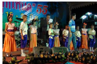
ภาพที่ 1 นักแสดงรำโทน (เยาวชน)

ต่อมานางไทรประพร แก้วชนะ ครูโรงเรียนวัดศรีไชย อ.สทิงพระ จ.สงขลา ได้มีแนวคิดที่จะฟื้นฟูการแสดงรำโทนขึ้น จึงได้ลงพื้นที่เพื่อศึกษาการแสดงรำโทนจากชาวบ้านที่เคยเป็นนักร้อง นักดนตรี และนักแสดงในคณะรำโทน และได้นำมาปรับให้เป็นแบบแผนมากขึ้น โดยรวบรวมเพลงและทำรำจากชาวบ้านมาได้ทั้งสิ้น 11 เพลงได้แก่ เพลงไหว้ครู เพลงมากันเถิดหนา เพลงโหมมย เพลงคำโบราณ เพลงคงก้า เพลงแอ็บป๊ยา เพลงพายังต์ เพลงยามเย็น เพลงตะแกล็กแต็ก และเพลงเดือนออก หลังจากนั้นก็ได้นำมาถ่ายทอดให้กับกลุ่มชาวบ้านที่สนใจและนักเรียนโรงเรียนวัดศรีไชย ต.คูชุด อ.สทิงพระ โดยถ่ายทอดทั้งเรื่องดนตรี การร้อง และการรำ โดยจัดเป็นกิจกรรมตอนเช้าหลังเคารพธงชาติเพื่อให้นักเรียนทุกคนสามารถแสดงได้เพื่อเป็นการอนุรักษ์การแสดงที่มีมาอย่างยาวนานในท้องถิ่น นอกจากนี้ยังออกแสดงในงานรื่นเริงต่างๆ ซึ่งนักเรียนโรงเรียนวัดศรีไชยที่ได้รับการถ่ายทอดรำโทนนั้นไม่เคยรู้จักรำโทนมาก่อนเลย เพิ่งได้มารู้จักและหัดรำจากครูไทรประพร แก้วชนะ เมื่อได้มาหัดรำก็รู้สึกชอบและอยากรำอย่างต่อเนื่อง ทั้งยังมีความเห็นว่าเป็นการแสดงที่ควรอนุรักษ์ไว้ให้อยู่คู่กับอ.สทิงพระ จ.สงขลา