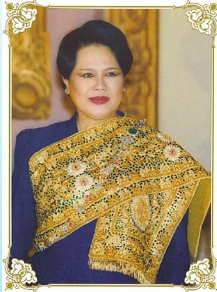
วันเฉลิมพระชนมพรรษา 12 สิงหาคม วันแม่แห่งชาติ

ฉบับที่ 3 ปีที่ 1 เดือนมีนาคม - กรกฎาคม 2554