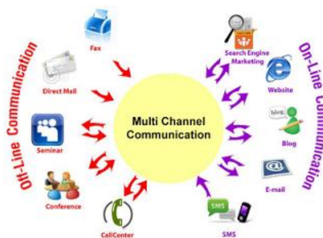
ภาพ 2.5 การสื่อสารข้อมูล